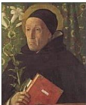
6 Meester Eckhart

De dominicaan Eckhart, is de meest gekende mystieker van de Lage Landen tot aan de Rijn. Na zijn studie in Parijs, waar hij meester in de theologie werd, studeerde en werkte hij te Keulen waar hij met de begijnenmystiek van onder meer Hadewijch en Margarete Porete in contact kwam. Hij vergelijkt de vereniging met God met een druppel water die terug naar de oceaan vloeit, een beeld dat men ook in de Upanishads vindt. Met een woordenschat die hij ontleende van de begijnen beschreef hij hoe er in het diepst van de ziel iets bestaat dat ontsnapt aan tijd en ruimte en aan alle geschapenheid: het Ene, de ongenatuurde natuur, het zielevonkje. ‘Hoe meer ontledigd de mens van het geschapene is, des te klaarder vult het licht zijn ziel. Waarheid en inzicht worden haar deel.’ Verder zegt hij in een van zijn preken: ‘Naarmate de ziel meer van zichzelf loskomt en van al wat niet is, ervaart zij een sneller, zoeter en zaliger drang naar het Ene. Minder gelijkvormig aan zichzelf en aan het