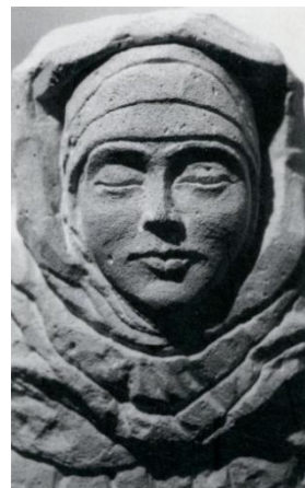
5 Beeld van een begijn

Liefde is God en God is Liefde’, zoals zij in haar dichtwerk schrijft met als titel: ‘Spiegel van de eenvoudige zielen’. Het werk wordt gezien als een dialoog tussen Minne, Rede, Ziel, Verlangen en Waarheid. Margarete schrijft: ‘Hetgeen de ziel niet overstijgt, is niet, enkel het Al bestaat’ en verder: ‘Een eenvoudige ziel wordt gered door het geloof zonder werken; zij leeft voor de Minne, zij heeft iedere eigen wil verloren. Zij doet afstand van de deugden.’ Deze laatste uitspraak werd Margarete Porete fataal. De inquisitie beschouwde dit als ketters, zij werd op 1 juni 1310 in Parijs op de brandstapel gebracht.