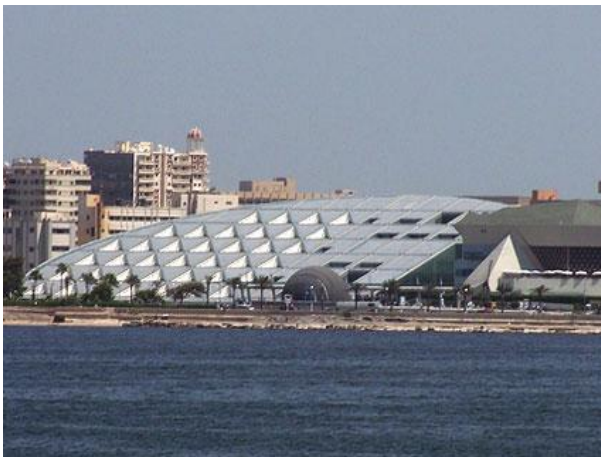
1 De Huidige bibliotheca Alexandrina

Gesticht in 331 voor Christus, na de verovering van Egypte door Alexander De Grote, groeide Alexandrië uit tot een wereldhaven. Niet alleen de landen van de middellandse zee deden de haven aan. Een gunstige moessonwind verzorgde ook het contact met het verre India. De stad was een smeltkroes van culturen waar de wijsheid uit de Egyptische oudheid geconfronteerd werd met de Griekse filosofie en de joodse traditie. De aanwezigheid van het Serapeion, de legendarische bibliotheek van Alexandrië, waar ook oosterse werken aanwezig waren, zorgde mede voor een goed cultureel, filosofisch en spiritueel klimaat. In die sfeer van kennis ontstond een bloeiende wijsheidsliteratuur, toegeschreven aan Hermes Trismegistus.