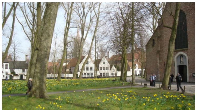
3 Begijnhof Ten Wijngaerde te Brugge

In diezelfde periode verscheen de benedictijner monnik Willem van Saint Thierry op de voorgrond. Hij was sterk bevriend met Bernardus en wordt gezien als de vader van de mystiek der lage landen. Wanneer beide abten door ziekte overmand op kracht komen in hetzelfde landhuis, delen zij hun innerlijke ervaring: ‘Er is een vergelijking met God: ... die noemen wij niet meer gelijkenis, maar unus spiritus, eenheid van geest.’ Willem komt tot zijn diepste inzicht als hij de kus van de geliefde beschrijft als uiterlijk teken van een geestelijke vereniging in diepe wederzijdse overgave. In zijn Gulden Brief schrijft Willem: ‘De volmaaktheid wordt bereikt als de rede overgaat in de liefde van het hart.’