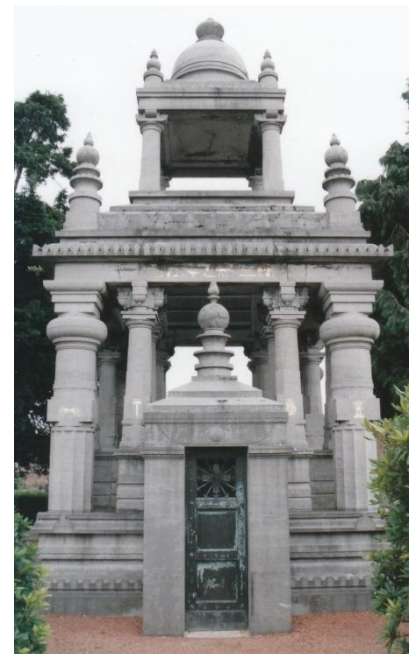
12 'Het Unieke Wezen heeft verschillende namen' Opschrift op het mausoleum van graaf Eugène Goblet D'Alviella uit 1886 in Court St.Etienne

Het pad leidt tenslotte tot dezelfde eenheidsbeleving in West en Oost. Hadewijch drukt het als volgt uit: 'Wanneer alle dingen zullen