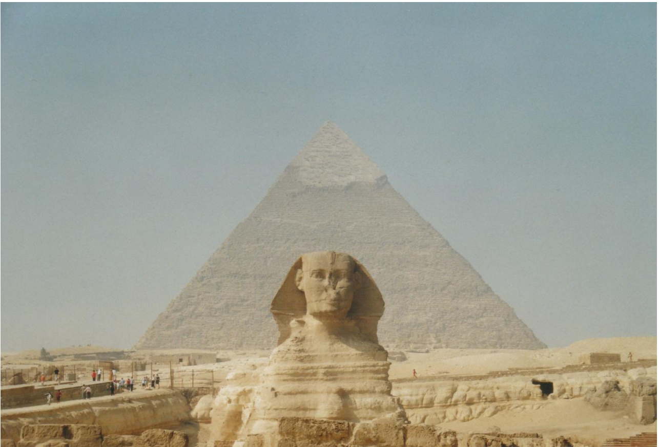
2 In de schaduw van de grote piramide werd de wijsheid doorgegeven