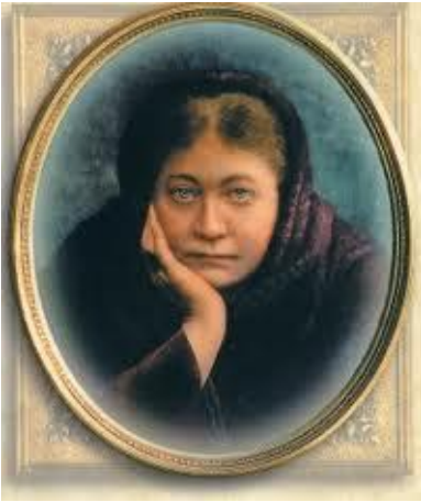
8 Mevrouw Blavatsky

De soms fel omstreden mevrouw Helena Petrovna Blavatsky is de mede oprichtster van de Theosophical Society in 1875. Met de Theosofische Vereniging wilde zij samen met de medeoprichters de toenmalige maatschappij doordringen met ideeën en leringen van de wijsheidsreligie. Zij wilde een universele broederschap oprichten die de occulte wetenschap bestudeert. In 1878 trekt zij met de Amerikaanse medeoprichter Olcott naar Bombay. Onder het motto 'Er is geen godsdienst hoger dan de Waarheid' verspreidt De Universele Broederschap zich in India. Zij verklaart dat haar voornaamste werk 'De geheime leer' (1888) gebaseerd is op zowel de wijsheidsstelsels van het hermetisme als van het hindoeïsme. Zij schrijft: 'Zo kan worden aangetoond dat alle grondwaarheden van de natuur in de oudheid algemeen verbreid waren en dat de basisideeën over geest, stof en het heelal of over God, substantie en de mens dezelfde waren. Als men de twee oudste religieuze stelsels van de wereld, het